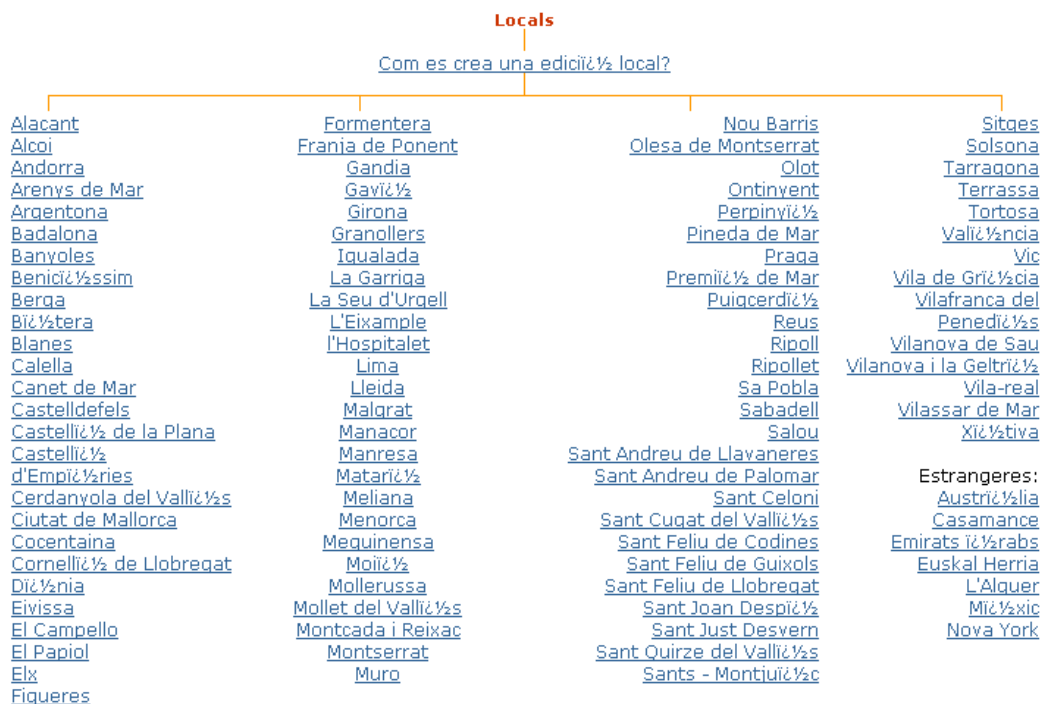
Figura 2. Mapa de les edicions locals de VilaWeb, abril del 2003

El procés per a crear edicions locals era ben senzill en un començament. Només calia la voluntat d'una empresa, una persona, o un grup de persones interessats en acceptar unes condicions bàsiques: el pagament d'una quantitat de diners (10.000 de les antigues pessetes), el coneixement de la llengua i l'interès per informar de la seua població 6 . Les condicions incloïen un compromís de veracitat i el responsable de l'edició local es comprometia a acceptar els principis de no-incitació a la violència i de no-discriminació per raó de sexe, edat, religió, origen nacional, discapacitació o orientació sexual. Aquest acord donava dret a gestionar la publicitat pròpia a cada local, reservant-se VilaWeb la gestió d'un dels banners principals (Partal, 2000: 81). A canvi, VilaWeb ofería una portada i un senzill formulari per a actualitzar-la des del navegador, un fòrum de debat propi, un correu electrònic, la inclusió en una llista de correu de webmasters per a discutir el funcionament del projecte, l'ús del servidor de xat i un servei d'estadístiques per saber el nombre d'internautes que hi accedien a la local.