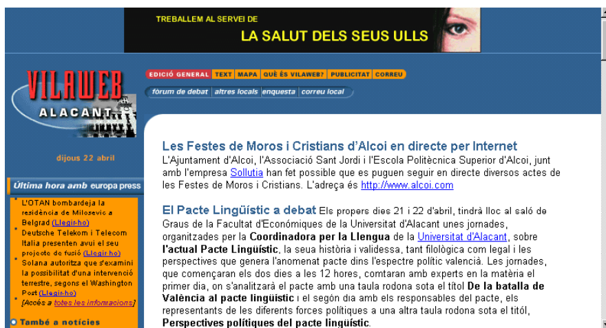
Figura 5. Portada de VilaWeb Alacant l'any 1999, amb un banner publicitari