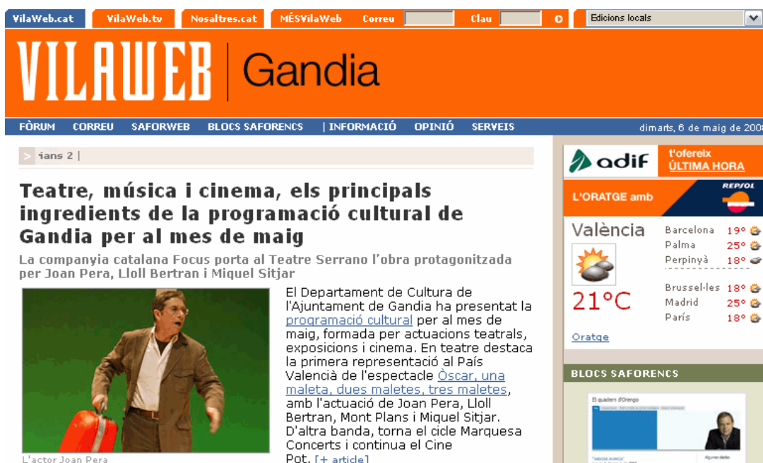
Figura 4. Imatge de la portada de VilaWeb Gandia (Font: http://www.vilaweb.cat/gandia )