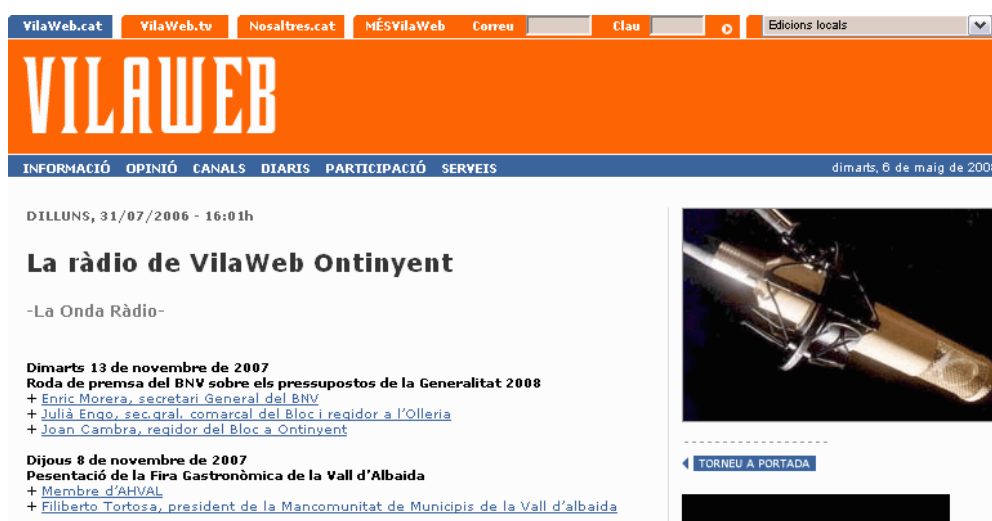
Figura 5. Imatge de la Ràdio de VilaWeb Ontinyent